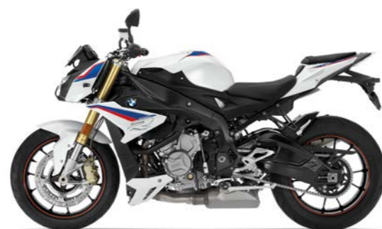
N2E - Light White / Racing Blue Metallic / Racing Red