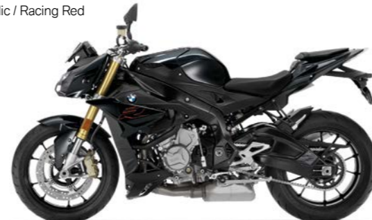
ND2 - Black Storm Metallic