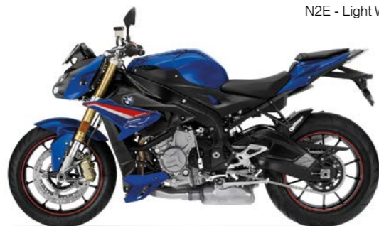
N2X - San Marino Blue Metallic