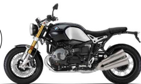
ND2 - Black Storm Metallic