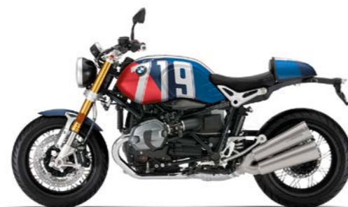
H09 - Mars Red Metallic Matt/Cosmic Blue Metallic Matt