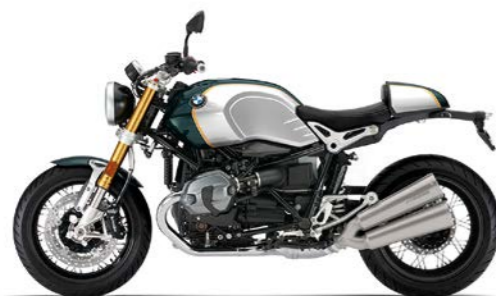
H07 - Polux Metallic/Aluminium