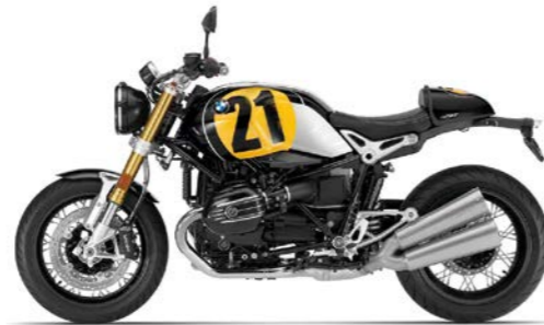
H01 - Black Storm Metallic/Vintage