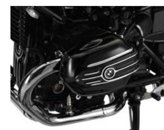
Cache-culbuteurs "Machined" 1 299,00 € ou 40,00 € /mois