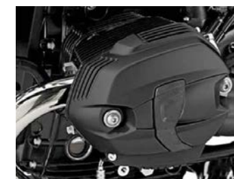
Cache-culbuteurs noir 453,36 € ou 14,00 € /mois