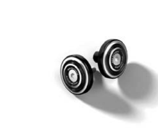
Embouts de guidon "Machined" 80,00 € ou 3,00 € /mois