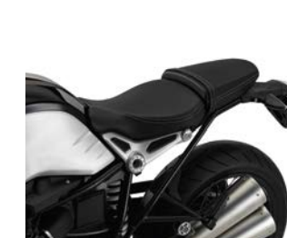
Selle passager confort 255,41 € ou 8,00 € /mois