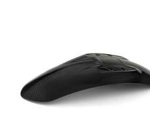
Garde-boue avant carbone HP 433,00 € ou 14,00 € /mois