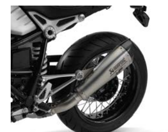
Silencieux sport Akrapović 1 209,74 € ou 38,00 € /mois