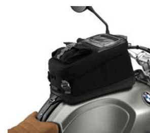
Sacoche de réservoir étanche 242,00 € ou 8,00 € /mois