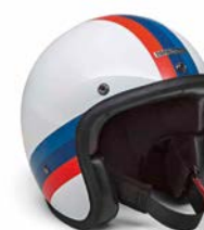
Casque Bowler Tricolore 500,00 €