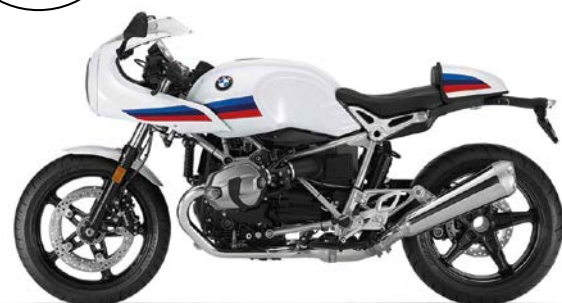
NB5 - Light White