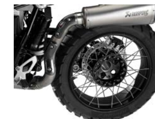
Roue à rayons croisés 1 855,90 € ou 57,00 € /mois