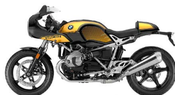
H05 - Black Storm Metallic/Aurum