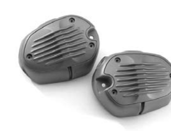
Cache-culbuteurs "2 soupapes" 604,00 € ou 19,00 € /mois