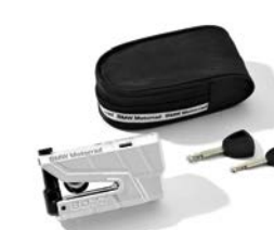
Bloké-disque de frein avec alarme antivol 189,00 € ou 6,00 € /mois