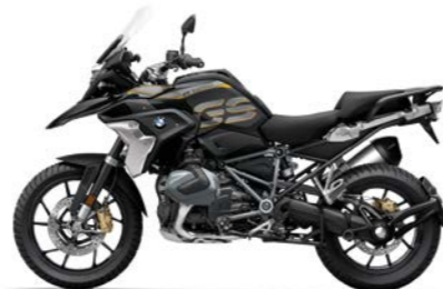
N2R - Black Storm Metallic / Night black Matt