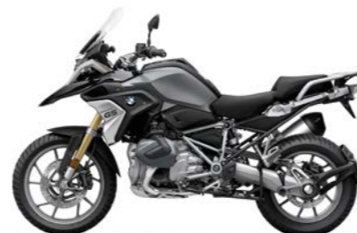
ND2 - Black Storm Metallic