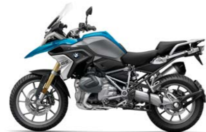
N05 - Cosmic Blue Metallic