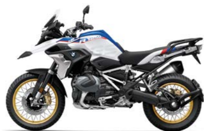
N2E - Motorsport